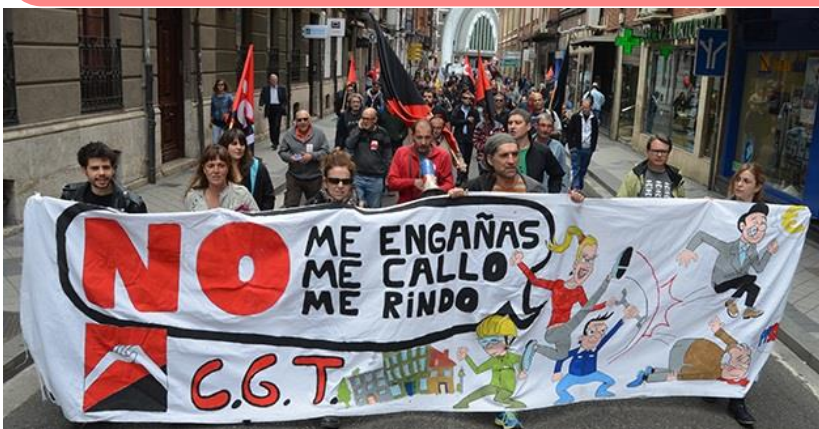
Manifestación de CGT en las calles