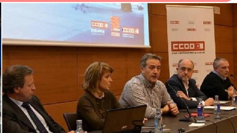
Jornadas de CCOO en Castilla-La Mancha